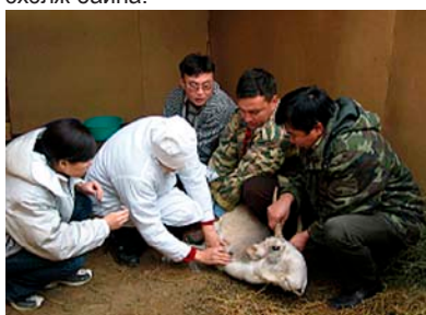
Цусны дээж авч байна.

Энэ төсөл нь INTAS-аар санхүүжин Лондоны эзэн хааны коллежийн удирдлагын дор Норвегийн Ослогийн их сургууль, Узбекистаны Шинжлэх Ухааны Академийн Амьтан судлалын хүрээлэн, Казакын үндэсний хөдөө аж ахуйн их сургууль, Халимагийн зэрлэг амьтдын хамгаалал, судалгааны төв, Казакстаны амьтан судлалын хүрээлэн, Оросын Шинжлэх Ухааны Академийн Экологи, эволюцийн хүрээлэн хамтран ажиллаж байна. Гурван жил үргэлжлэх төслийн 2 дахь жил нь дөнгөж эхэлж байна.