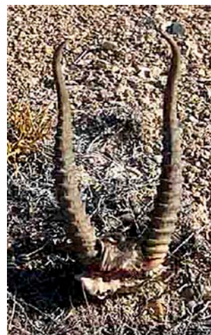
Зураг. Г авлын ясны хэсэг бүхий бөхөнгийн эвэр.