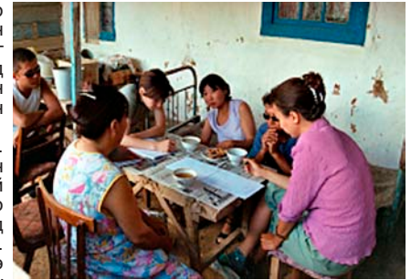
Халимаг дахь Таван гашуун тосгоны ард иргэдээс ярицлага авч буй нь.