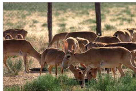
Сайгаки в вольерах питомника получают минеральные добавки, витамины и концентрированные корма перед отелом.