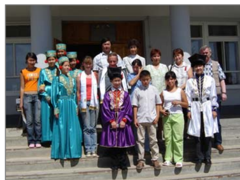
Учащиеся Яшкульской многопрофильной гимназии - друзья сайгачьего питомника.