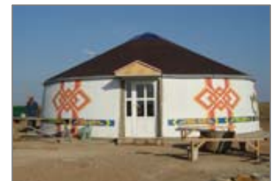
Новый визит центр на территории сайгачьего питомника «Яшкульский».

Подробнее на http://usembassy.ru/embassy/releaser.php?record_id=48