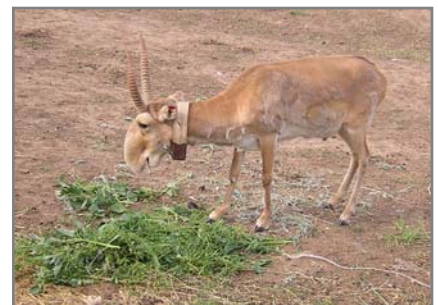
Самец сайгака с радиошейником.

Для дополнительной информации обращайтесь к директору Центра диких животных РК Ю. Н. Арылову, kalmisaigak@elista.ru