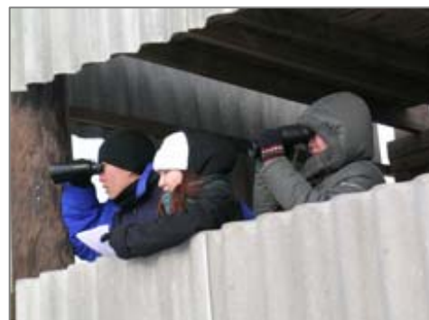
Студенты Биологического факультета Калмыцкого государственного университета проводят наблюдения за сайгаками во время гона.