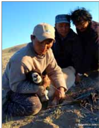
Члены полевой команды WCS закрепляют радио-ошейник на взрослую самку сайгака в природном резервате Шарга.

Программа подобного рода должна поддерживаться хотя бы в течение 6-8 лет. Самки достигают зрелости к 7-8 месяцам, а самцы только через полтора года. Создание вольерной популяции и выращивание достаточного для регулярного выпуска поголовья животных займет 3 года. Чтобы достигнуть проектных целей ежегодно нужно будет проводить последующие выпуски. Сейчас предпринимаются усилия для нахождения необходимого финансирования.