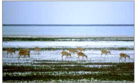
Мигрирующие сайгаки.

Ранее считалось, что на плато Устюрт пребывает лишь одна группировка сайгака - устюртская, миграционные пути которой сильно меняются в различные годы: иногда она уходит на полуостров Бузачи или на Южный Устюрт, иногда - доходит до окрестностей песков Сам. Это объясняли либо интенсивным преследованием со стороны человека либо суровыми климатическими условиями. Позднее появилась точка зрения, что после восстановления ареала, в 1954 г., сайгаки северных пустынь проникли на плато Устюрт, где сформировали самостоятельные группировки, проложившие позднее новые пути миграций. Их зимовки располагаются на Южном чинке Устюрта, Джанаке, в Заунгузских Каракумах. На лето большая часть их уходит на север, а другие - оставались. Их численность в Северо-Западном Туркменистане в зимний период достигала 40-50 тыс. голов, а летом - от нескольких сотен до 30 тысяч особей. Цель данной работы - выяснение характера обитания сайгака на территории Арало-Каспийского водораздела, обширного пустынного региона, расположенного между Аральским и Каспийским морями, в Казахстана, Узбекистана (Каракалпакстана) и Туркменистана.