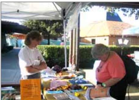
Участники Экспо-2006 (сверху): экспозиция Союза по сохранению сайгака (снизу).

В этом году Союз по сохранению сайгака был приглашен для участия в ежегодной Международной выставке по охране природы - Экспо-2006, которая проходила с 6 по 8 октября в Лос-Алтосе, штат Калифорния, США. Выставка Экспо-2006 была организована Сетью по сохранению дикой природы (WCN).