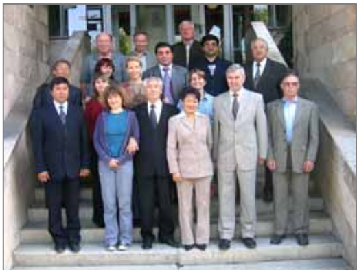
Специалисты по сайгаку встретились в Алматы.

Заключительная встреча участников проекта INTAS «Репродуктивная экология критически угрожаемой антилопы сайги» состоялась 21-22 сентября 2006 г. в г. Алматы, Казахстан. Встреча позволила нам обменяться научными результатами и идеями, согласовать стратегию анализа и публикации результатов в последующий период вплоть до окончания проекта (март 2007 г.). Проект выполнялся в Казахстане, Узбекистане и России. Основная цель состояла в создании и тестирования мониторинговых протоколов, включающих данные по распространению и характеристикам стад сайгака и неинвазивным методам наблюдения за репродуктивным успехом. Проект также взаимодействовал с недавно завершённым проектом Дарвинской Инициативы «Использование сайгака для повышения благосостояния сельского населения», в рамках которого разрабатывались сходные стандартные инструменты мониторинга для проведения социологических исследований отношения людей к сайгаку и их поведения по отношению к этому виду. И, наконец, мы распространяем информацию о сохранении сайгака и его экологии среди ученых, местных жителей и политиков.