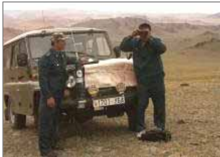
Антибраконьерская мобильная группа Ирбис-3.