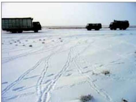
Следы сайгака, пересекающие автодорогу в р-не ст.Жаслык (декабрь 2004 г.).

Истребление и вывоз туш сайгаков продолжался в течение нескольких дней, однако, ни администрации указанных населенных пунктов, ни правоохранительные органы не предприняли никаких мер по предотвращению этой бойни. Высокая численность мигрировавших в тот год сайгаков была связана не с увеличением их численности, а с небывало обильными снегопадами и недоступностью кормов в Казахстане. Чтобы избежать дальнейшего истребления сайгакам пришлось изменить многолетние миграционные пути; теперь они, не углубляясь на территорию плато, в районе пос. Комсомольск-на-Устьурте спускаются по Аджибайскому спуску на осушенное дно Арала и мигрируют на восток, в сторону Тахтакупырского района РК, граничащего с Кызыл-Ординской областью Казахстана, где зимуют среди зарослей саксаульника. Нужно отметить, что новые места зимовок менее благоприятны по климатическим условиям, запасам и разнообразию кормов, наличию закрепленных саксаульниками барханных песков, служащих укрытием от пронизывающего ветра, чем прежние, расположенные в Туркменистане. Новые миграционные пути также сопряжены с определенным риском, т.к. сайгаки вынуждены пересекать значительные расстояния (около 200 км) по открытой местности, где в настоящее время эксплуатируется ряд газовых месторождений.