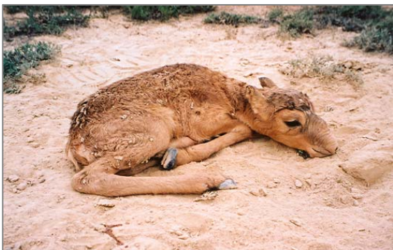
Сайгаченок. Плато Устюрт, Казахстан.

Исследования проводились на территории казахстанского Устюрта в 2004-2006 гг. Отел у сайгака в 2004 г. начался 14 мая. В период с 14 по 26 мая встречено всего 595 детенышей. Вес детенышей в возрасте от 0,5 до 2 суток составлял 3100-3850 г, длина тела – 510-600 мм (n=9), в возрасте 3 суток, соответственно, 3950-4600 г и 600-660 мм (n=4). Различия в размерах между самцами и самками небольшие. Из 13 детенышей было отмечено 7 самцов (53,8 %) и 6 самок (46,2 %). У самок чаще рождалось по одному детенышу, чем по два. Так из 133 встреч в 87 случаях (65,4 %) было отмечено по одному детенышу и в 46 (34,6 %) – по два. В среднем, на 1 рожавшую самку приходится 1,34 детеныша. Плодовитость популяции, по сравнению с прошлым периодом, когда она была благополучной, снизилась; ранее в среднем на 1 самку (включая яловых) приходилось 1,5 детеныша. В данном случае количество яловых самок установить точно невозможно. Ориентировочно соотношение «детеныши-самки» можно оценить, подсчитав число их встреч в последние два дня работы экспедиции (25-26 мая), когда с большой долей уверенности можно было предположить, что все детеныши находятся с самками, поскольку животные уже начали мигрировать с места отела к северу. За этот период встречено 334 детеныша и 578 самок, т.е. на 1 самку, в среднем, приходится 0,57 детенышей. Это соотношение, очевидно, ближе к реальному, так как здесь присутствуют и яловые самки.