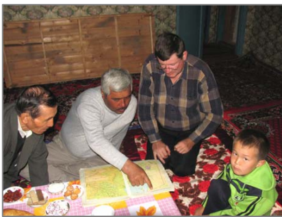
Проведение опроса в п. Жаслык.