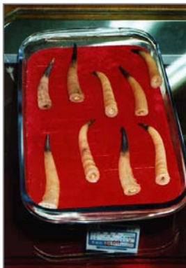
Рога выставленные на продажу в китайской аптеке.

Подробнее на http://www.interfax.ru/r/B/politics/2.html?id_issue=11656506 .