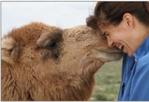
Встреча с верблюдом в Узбекистане – с любовью от «местных»!

Дорога в бескрайней степи была долгой, но мы чередовали это время с остановками для фотографирования. Обочины пестрели красными маками, нам встречались местные виды грызунов и птиц, стада овец всех цветов и мастей, пасущиеся огромные и полные благородства верблюды, время от времени попадались ослы и лошади. Еда в пути всегда была интересной и вкусной, и конечно составляла часть приключения. По дороге мы останавливались на ночь в Самарканде, Бухаре и Нукусе. Каждый город имеет свой неповторимый шарм, включая потрясающие мечети украшенные голубой и белой мозаичной плиткой ручной работы. История этих мечетей насчитывает столетия экзотических культур и древних цивилизаций.