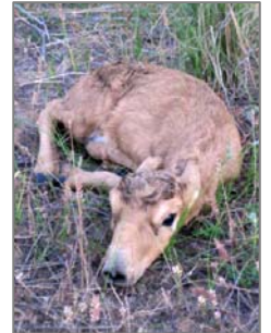
Новорожденный сайгачонок.