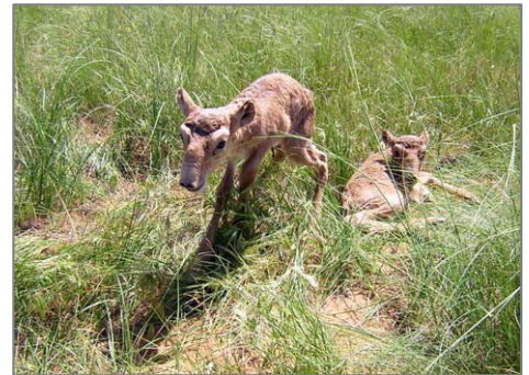
Сайгачата в Биосферном заповеднике «Черные земли», Калмыкия, май 2004 г.

Мы планируем продолжать работу, начатую проектом ИНТАС с практическим фокусом на понимании причин передвижений сайгака и изучении потенциала мониторинга с участием местного населения как инструмента по сохранению и управлению сайгаком. К сожалению после 12 лет непрерывной поддержки изучения сайгака, ИНТАС больше не будет финансировать любые будущие исследования, поскольку Европейский Союз прекратил финансирование этой организации. Однако мы уверены, что сильная сеть созданная в рамках последнего проекта, позволит нам продолжить наше очень продуктивное сотрудничество в рамках новых источников финансирования.