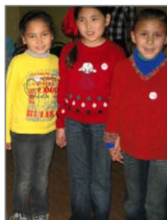
Дети из Астраханского детского дома носят значки SCA, поддерживая его миссию.

Мы также будем направлять наши усилия по поиску финансирования и ресурсы программы малых грантов на присоединенные проекты.