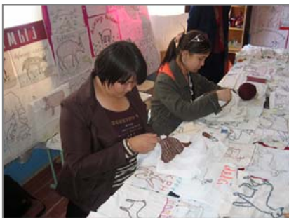
Ученицы школы №56, пос. Каракалпакия вышивают сайгака.