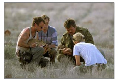
Участники команды SCA обследуют сайгаков на Устюрте.

Членами Союза по сохранению сайгака могут быть отдельные лица и организации. Мы включим их в список членов Союза и обеспечим доступ к сетевым ресурсам SCA, например, через рассылку сообщений. Мы надеемся, что члены пожелают присоединить к Союзу их проектные действия по сохранению сайгака. Присоединенные проекты будут иметь возможность использовать эмблему SCA, бесплатно размещать информацию по проекту на вебсайте Союза и на страницах Saiga News в рубрике «Обзор проектов».