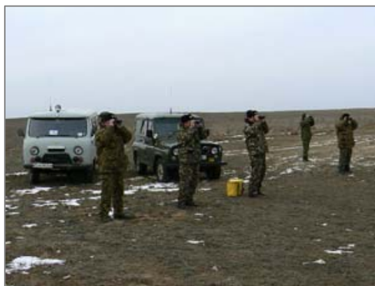
Сотрудники заказника в степи на охране.

Над выполнением этих и других задач работают сотрудники заказника, в штате которого насчитывается 10 человек. На оснащении инспекторов 4 автомобиля, оборудованных радиостанциями и приборами ночного видения, 2 спортивных мотоцикла «Кавасаки» и «Ямаха», оружие и спецсредства, навигационные приборы и бинокли, полевое оборудование, видеокамеры и фотоаппараты. С инспекторами регулярно проводятся занятия по изучению правовых и других документов, принимаются зачеты по правилам применения оружия и спецсредств.