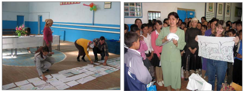
Подведение итогов конкурса на лучший рисунок о сайгаке в школе № 26, пос. Каракалпакия (слева); награждение победителей конкурса вышивки на тему о сайгаке, школа №56, пос. Каракалпакия (справа).

Для получения дополнительной информации обращайтесь к Е.Быковой и А.Есипову, esip@tkt.uz .