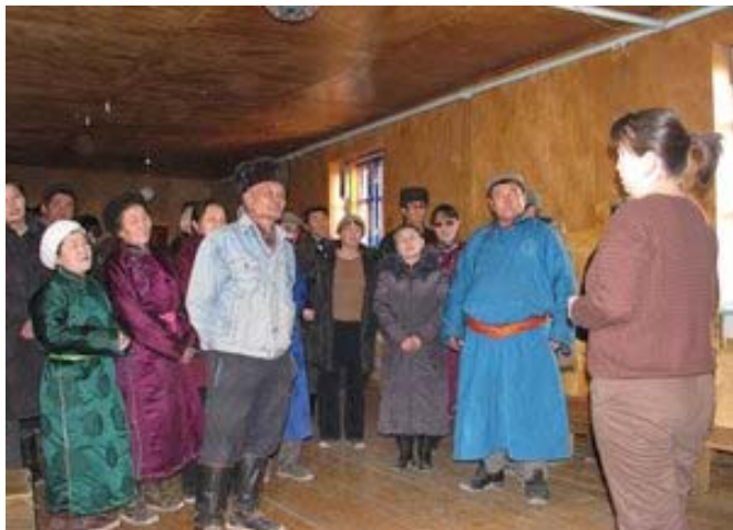
Малчдын бүлгүүд хамтын оролцооны аргад суралцаж байгаа нь

Дэлхийн байгаль хамгаалах сан (WWF)-гийн Монгол бөхөн хэмээх шинэ том төсөл МАВА сангийн дэмжлэгтэйгээр 2007 оны 10-р сард эхэлсэн. Энэ төсөл нь орон нутаг дээр суурилсан мониторингийн программыг нутгийн иргэд, байгаль хамгаалагчдад эзэмшүүлэх, ан агнуурын хууль тогтоомжид нэмэлт өөрчлөлт оруулах, хамгаалалтын ажилд засгийн газрыг татан оруулах зэрэг ажлуудыг аль хэдийнээ амжилттай хийсэн байна.