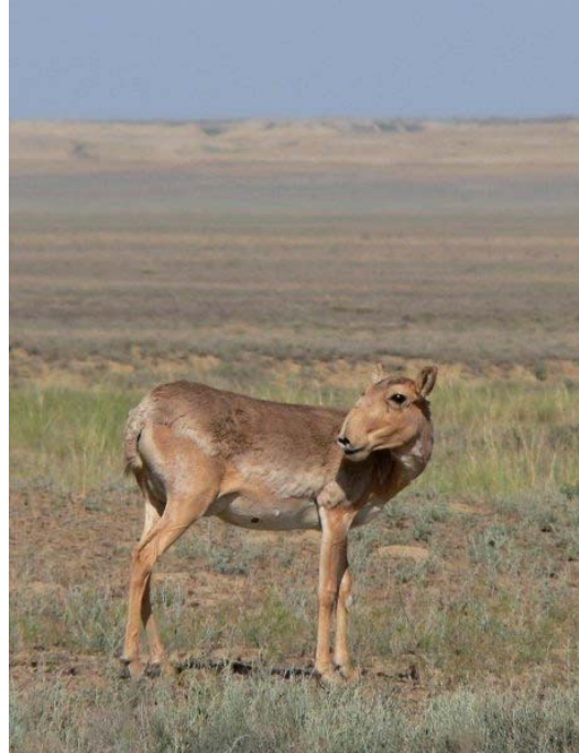
Үржлийн үеийн эм бөхөн. Бетбакдала.

“Алтин Дала” Байгаль Хамгаалах Санаачлага (ADCI) нь томоохон хэмжээний төсөл бөгөөд цөлөрхөг хээрийн экосистем, тал хээрийн хойд хэсэг төдийгүй уг бүс нутгийн шүхэр зүйл болох нэн ховор соргог бөхөн ( Saiga tatarica tatarica ), хавтгаалж шувууг ( Vanellus gregarius ) хамгаалахад чиглэгдсэн үйл ажиллагаа явуулдаг. Уг санаачлагыг Казахстаны засгийн газар, Казахстаны Биологийн Олон Янз Байдлыг Хамгаалах Холбоо (ACBK), Франкфуртын Амьтан Судлалын Нийгэмлэг (FZS),