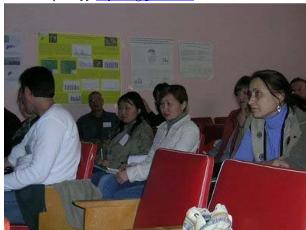
Оролцогчид олон улсын сургалтын үеэр