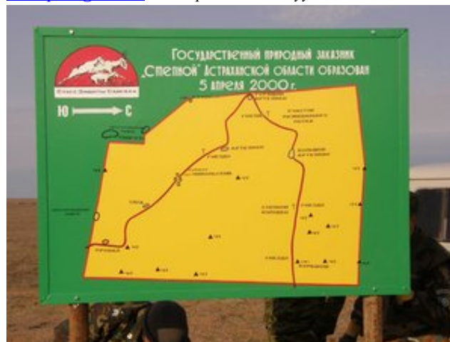
Степной дархан газрын экологийн замын бүдүүвч Зургийг Анатолий Хлуднев

Тэнд амарч байгаа болон ярилцах хүмүүст зориулсан газрууд, нөгөө талаас бөхөн байнга ирдэг цэвэрхэн тогтоол уснууд, махчин шувуудад зориулан босгосон хиймэл үүрнүүд бий. Экологийн боловсролын ажил ирээдүйд улам бүр өргөжин хөгжих болно. Илүү мэдээлэл авахыг хүсвэл limstepnoi@mail.ru хаягаар холбогдоно уу.