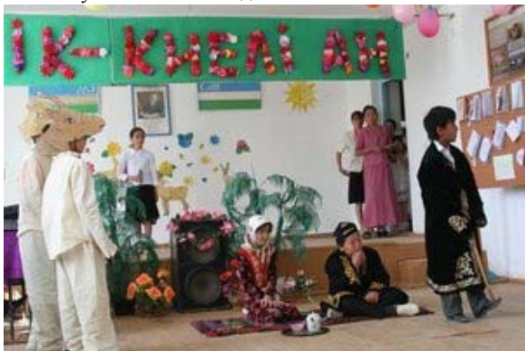
Яшлик тосгон дахь бөхөнгийн урлагийн тоглолт.

WCN-ээс санхүүждэг Бөхөн хамгаалах холбооны баг нь хэдэн жилийн турш Устюрт, Узбекистаны хүүхдүүдэд боловсролын хөтөлбөрийг аль хэдийнээс хэрэгжүүлсэн билээ. Хулгайн ангийн түвшин өндөр байдаг тосгоны (Яшлик, Каракалпак) гурван сургуулийн багш, хүүхдүүд, түүгээр зогсохгүй тэдгээрийн эцэг эхчүүд бөхөн хамгаалах хөтөлбөрийн идэвхитэй хэсэг болж байна. Устюртийн тэгш өндөрлөгийн зүүн хэсгийн алслагдсан районд орших (Кубла-Устюрт) шинэ тосгоноос ирсэн сургуулийн хүүхдүүдийг оролцуулснаар манай хөтөлбөр улам бүр өргөжсөөр байна. Бөхөнгийн тухай урлагийн тоглолт сургуулиуд дээр 2008 оны 3-4-р сард болсон. Хүүхдүүдийн, багш нарын, эцэг эхчүүдийн нилээд их ажил, урлагийн тоглолтонд орсон. Хүүхдүүд бөхөнгийн тухай түүх, шидэт үлгэр, богино өгүүллэг, шүлэг бичсэн. Шүүгчдийн бүрэлдэхүүнээс сонгон авсан хамгийн сайн түүхийг урлагийн тоглолтын тухай киног хийхэд ашиглажээ.