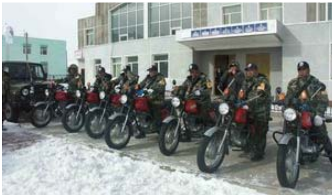
Бөхөн хамгаалагчдын сүлжээ.

Энэ хэрэг цагдаад шалгагдаж байна. 2006 онд баригдсан 54 бөхөн хулгайгаар агнасан хэргийг дахин хянан шалгаад 2007 оны 10-р сард шүүх шийдвэрлэсэн. Дэлхийн байгаль хамгаалах сангийн Монгол дахь хөтөлбөрийн газар нь эхний хэргийг үл ойшоож байсан орон нутгийн шүүгчдийг жагсаалтыг гаргаж, мэргэжлийн бус удирдлагуудыг огцруулахад үүрэг гүйцэтгэсэн. 2008 оны 1-р сарын тооллого судалгаагаар 13000 км 2 нутагт 3240 бөхөн гэж үнэлсэн нь 2007 оныхоос 11.8%-иар өссөн байна. Энэхүү эргэн тойрон дахь явдал нь ердөө баримтууд бөгөөд Дэлхийн байгаль хамгаалах сан (WWF)-гийн Монгол дахь хөтөлбөрийн газрын дэлгэрэнгүй тайлан SCA вебсайтад хангалттай байгаа. Илүү нарийн мэдээлэл авбал Б.Чимэддорж, chimeddorj@wwf.mn -д холбогдоно уу.