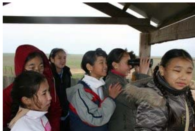
Яшкилын үржүүлгийн төв дэхь Халимагийн сургуулийн хүүхдүүдийн аялал