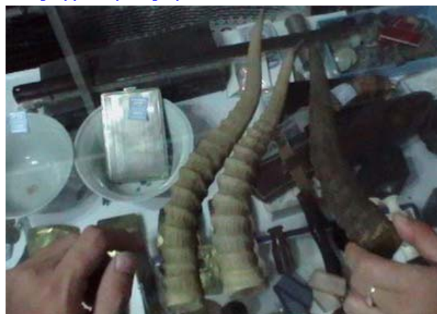
Захуудаас хураагдсан бөхөнгийн эвэр.

Канминг нисэх буудлын аюулгүйн хяналтын үеэр 2008 оны 1-р сарын 20-нд Зежианг мужийн иргэн хатагтай Лигийн тээшнээс хоёр ширхэг бөхөнгийн эвэр илэрсэн ба түүнийг саатуулсан байна. Ли хэлэхдээ тэрээр уг хоёр эврийг Канминг хотод байрлах Хятадын Анагаах Ухааны Эм (ХАУЭ) зардаг Жихуаюан зах дээрээс худалдаачин Зоугаас нийт 1800 рмб (~225$)-аар хадам ээжийнхээ эмчилгээнд зориулан худалдан авсан хэмээн мэдэгджээ. Уг мэдээллийн дагуу орон нутгийн цагдаагийн газар тухайн өдрийн орой ХАУЭ-ын Жихуаюан зах дээрх Зоугийн дэлгүүрт шалгалт хийхэд 28 бөхөнгийн эвэр илэрчээ. Зоу мэдүүлэхдээ уг эврүүдийг гурван жилийн өмнө ХАУЭ-ын зах дээрээс Шинжианы иргэдээс 30 эврийг кг-ийг нь 6800 рмб (~850$)-оор тооцон худалдан авсан хэмээн хэлжээ. Хятадын Шинжлэх Ухааны Академийн харъяа Канмингийн Амьтан Судлалын Хүрээлэнгийн шинжээчдийн дүгнэлтээр эдгээр 30 эврийн 22 нь бөхөнгийн эвэр болох нь тогтоогдсон бөгөөд бөхөн нь Хятадын Дархан Цаазтай Амьтдын 1-р зэрэглэлд багтдаг байна. Одоогоор уг хоёр сэжигтнийг эрүү үүсгэн шалгаж байна.