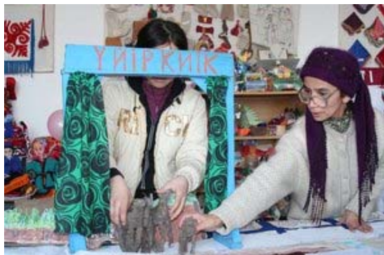
Каракалпак тосгон дахь жүжгийн хүүхэддэй сургууль