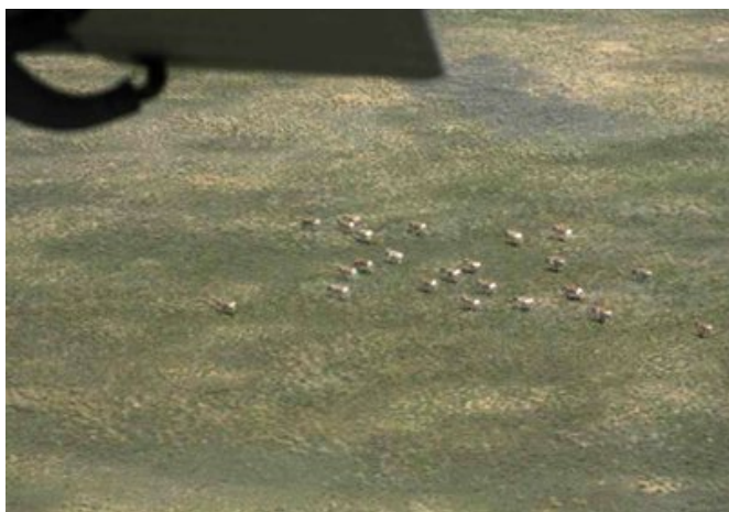
Оngoцны далавчин доорх бөхөнгийн сүрэг.

2007 оны судалгаатай харьцуулахад нийт бөхөнгийн тоо толгой 11.3% өссөн хэдий ч Устюртын бөхөнгийн популяцийн тоо буурсан дун гарчээ. Узбекистаны Устюртын бөхөнгийн популяци яагаад буурсан талаарх асуулт өнөөг хүртэл нээлттэй хэвээр байна. Магадгүй цаг агаарын нөхцлөөс шалтгаалан жилээс жилд тоо толгой нь хэлбэлзсэн байж болох юм. Иймээс энэхүү асуудлыг шийдэхийн тулд хоёр улс бөхөнгийн агаарын тооллогыг нэгэн зэрэг явуулах шаардлагатай. Дэлгэрэнгүй мэдээлэл авахыг хүсвэл Казахстаны Амьтан Судлалын Хүрээлэнгийн Юрий Грачевтай холбоо барина уу! terio@nursat.kz .