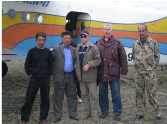
Охотзоопром болон Амьтан судлалын хүрээлэнгийн хамтарсан баг Уралын популяцийн тархац нутгийг судлах үеэр.