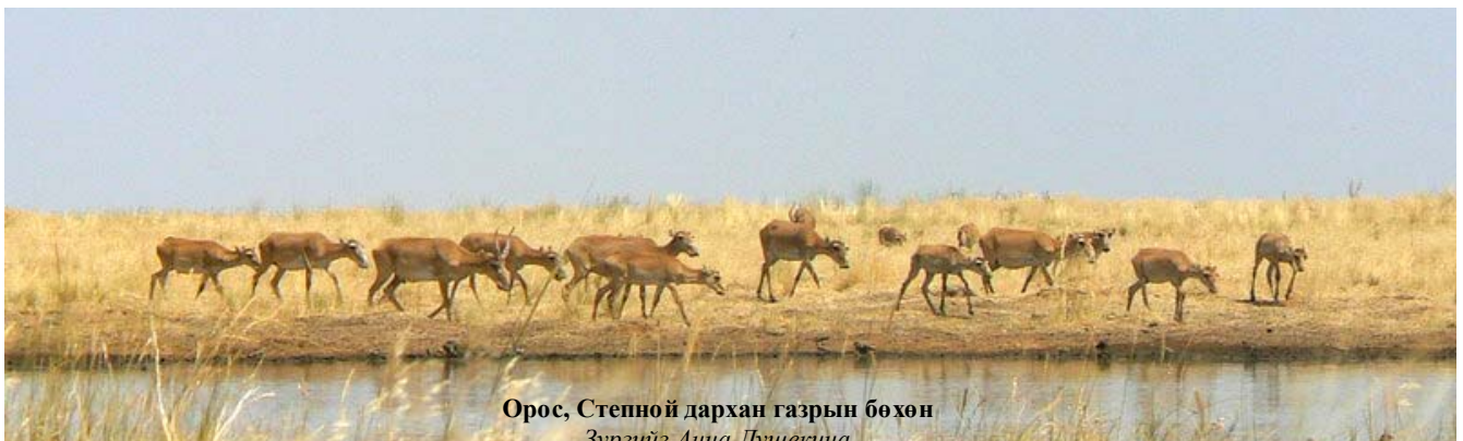
Орос, Степной дархан газрын бөхөн

Та бүхэн илүү тодорхой мэдээлэл болон өргөдлийн маягтыг www.saiga-conservation.com , эсвэл esipov@sarkor.uz , saigaconservationalliance@yahoo.co.uk хаягаар хандан e-майл-ээр авч болно. 2008 оны 9-р сарын 30-ны өдөр өргөдөл хүлээн авах хугацааг хаах бөгөөд төсөл 2008 оны 11-р сарын 15-наас нэг жилийн хугацаатай үргэлжилнэ.