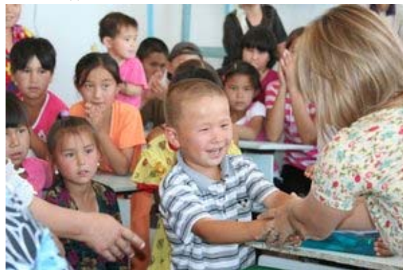
Кубла-Устюрт тосгон дахь урлагийн тэмцээний ялагчдыг шагнаж байгаа нь

Харамсалтай нь тэдний хэсэгхэн нь урлагийн тоглолтын талбайд тоглосон. Ирэх жил бид өөрсдийн ажлаа Узбекистаны хүүхдүүдийн бичсэн бөхөнгийн тухай шидэт үлгэрийн ном бэлдэхийн тулд багш нартай үргэлжлүүлэн ажиллах төлөвлөгөөтэй байна. Энэ нь хүмүүсийн бөхөн рүү болон байгаль руу хандах хандлагыг өөрчлөхөд ерөнхийд нь туслах болно гэдэгт бид бат итгэлтэй байна. Энэ нь зөвхөн уламжлалт агнуурын зүйл төдийгүй үндэсний өв, нутгийн соёлын нэг хэсэг болох бөхөн рүү хандах насанд хүрэгчдийн-эцэг эх, ах, эгч нарын хандлагыг өөрчлөх болон өсвөр үеийн хүмүүжлийг бий болгоход хүчтэй түлхэц өгөх болно. Цаашидын мэдээллийг авахыг хүсвэл SCA-ийн Елена Быкова болон Александр Есинов нартай esipov@sarkor.uz нартай холбогдоно уу.